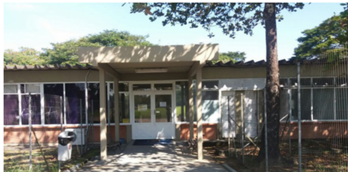
Fachada da SAVP-44

Atualmente, diversos serviços já podem ser solicitados por meio eletrônico através do preenchimento do Formulário Eletrônico (FEP) no Portal do Militar. https://www2.fab.mil.br/sti/